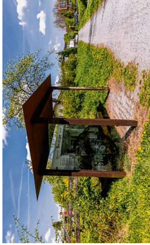
Hier, an der früheren Haltestelle Steufzgen, fuhr früher das Isny-Bähnle vorbei. Heute kann man auf der Strecke nach Weitnau und noch weiter radeln.

25 000 Euro stellt der Zweckverband für die Planung zur Verfügung. Die Kosten für das Material wird die Fritz-und-Brunnhilde-Englisch-Stiftung übernehmen. Lediglich das Personal, das die Haltepunkte einrichtet, muss die jeweilige Kommune selbst stellen. (kes)